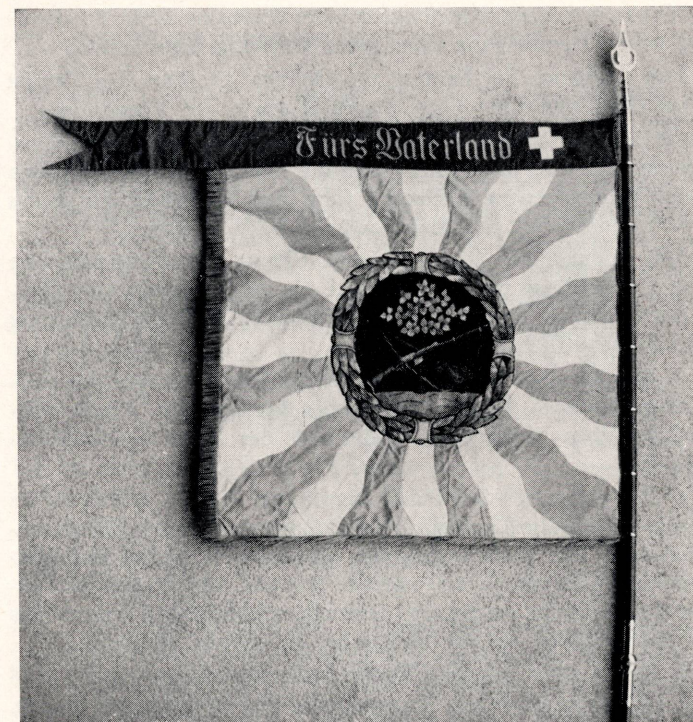
Die Fahne des Schießvereins Dietikon von 1900