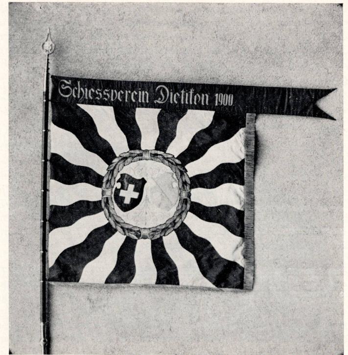
Die Fahne des Schießvereins Dietikon von 1900

Neue Statuten wurden im Jahre 1886 erstellt, 1888 der Beitritt zur Unfallversicherung für Zeiger und Schreiber verholten. Ab 1895 konnten auch Passivmitglieder aufgenommen werden. Im folgenden Jahre wird der Vorstand von der Bezahlung des Vereinsbeitrages befreit.