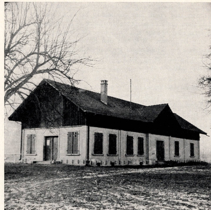
Das Dietikoner Schützenhaus

Die Jahre des Zweiten Weltkrieges ergaben das gleiche Bild wie beim ersten Völkerringen, indem wegen der Munitionssperre der Schießbetrieb lahmgelegt wurde. Erst ab dem Jahre 1944 konnten wieder Schießanlässe besucht werden. Zu gleicher Zeit erfolgte der Beitritt zum Kantonalen und Eidgenössischen Schützenverein. Das war die Einleitung für eine Zeit des Erfolges für den Schießverein. Der Mitgliederbestand beträgt heute 1196 Schützen, was dem Vorstand beachtliche Aufgaben zuweist, die mit Freude und Ausdauer übernommen werden.